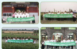
“寻艾中国”第一季第5期 (汤阴站)主产区研学游 📅 2024年6月6日 📍 河南省·汤阴县