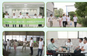
“寻艾中国”第一季第7期 (阜阳站)主产区研学游 📅 2024年6月27日 📍 安徽省·阜阳市