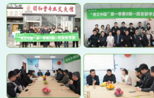
“寻艾中国”第一季第9期 (西安站)主产区研学游 📅 2024年11月27日 📍 陕西省·西安市