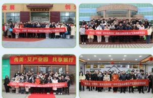
“寻艾中国”第一季第1期 南阳艾选品会暨主产区基地研学活动 📅 2024年1月18日 📍 河南省·南阳市

自2024年1月18日至今已完成南阳、郑州、蕲春、汤阴、明光、阜阳、潍坊、西安等8城9场主题研学活动。