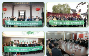
“寻艾中国”第一季第3期 (蕲春站)主产区研学游 📅 2024年3月18-19日 📍 湖北省·蕲春县